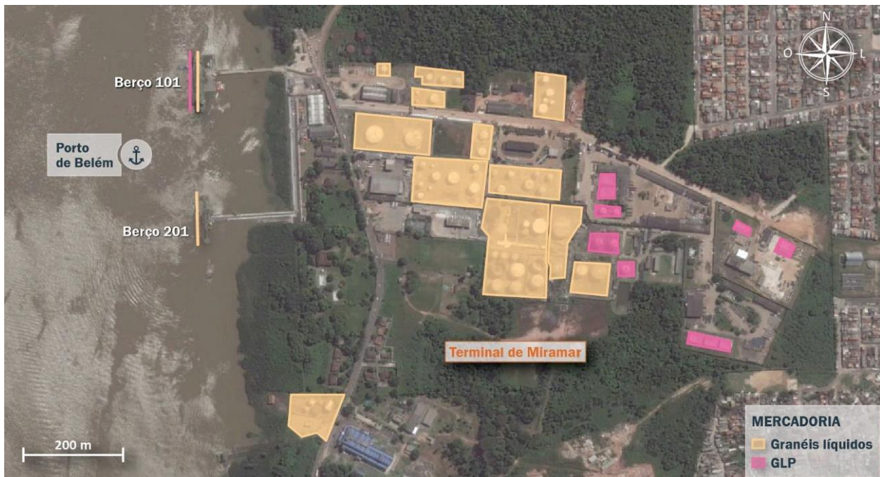
Figura 3: Destinações operacionais dos berços em relação às áreas de armazenagem

Com relação às infraestruturas de armazenagem, o Terminal Petroquímico de Miramar possui instalações de armazenagem de diversas companhias distribuidoras de derivados de petróleo, incluindo combustíveis líquidos e Gás Liquefeito de Petróleo – GLP.