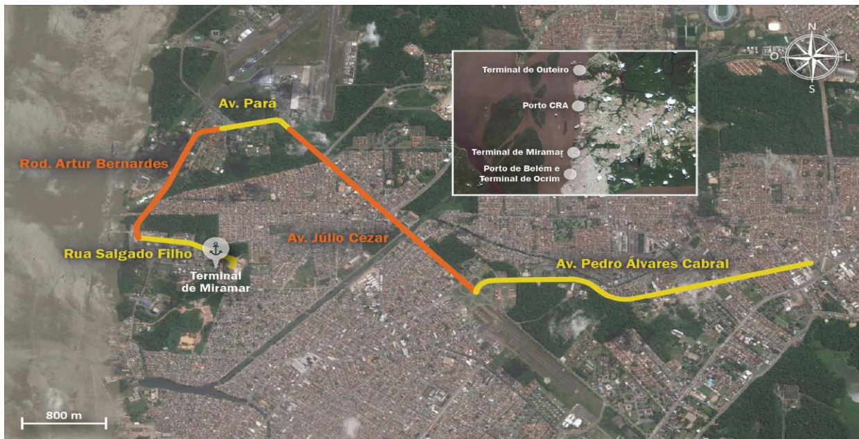
Figura 5: Vias de entorno ao Terminal Petroquímico de Miramar

O entorno do Terminal Petroquímico de Miramar é caracterizado pela existência de áreas urbanas, e seu acesso é feito, principalmente, pelas vias mostradas na figura a seguir.