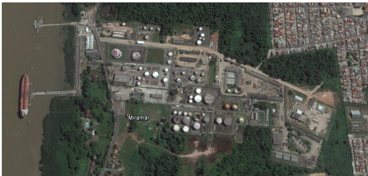
Figura 1: Localização do Terminal Petroquímico de Miramar

O Terminal Petroquímico de Miramar está localizado na margem direita da baía de Guajará, formada pelo encontro da foz dos rios Acará e Guamá, a uma distância de 5 km do Porto de Belém, circunscrito a áreas urbanas do município. A figura a seguir apresenta imagem aérea do Terminal de Miramar.