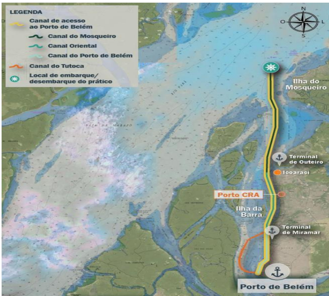
Figura 7: Canais de acesso ao Terminal de Miramar

O trajeto a partir do Mosqueiro rumo a Belém inicia-se pelo Canal do Mosqueiro até o Terminal Portuário de Outeiro. Em seguida, segue-se pelo Canal Oriental localizado entre a Ilha da Barra e a margem direita da Baía do Guajará. A montante do Terminal Petroquímico de Miramar, este canal recebe o nome de Canal do Porto de Belém; o Canal Oriental, situado entre a Ilha da Barra e a margem esquerda da Baía do Guajará, recebe à montante da Ilha da Barra, o nome de Canal do Tutoca.