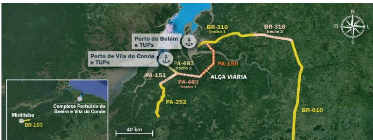
Figura 4: Vias de acesso ao Terminal Petroquímico de Miramar

Além dos acessos aquaviários (hidroviário e marítimo), o Terminal Petroquímico de Miramar é dotado de acesso rodoviário, tendo conexão com sua hinterlândia por meio da BR-316 e BR-010, conectando-se à alça viária pelas rodovias PA-150, PA-483 e PA-151, conforme figura a seguir.