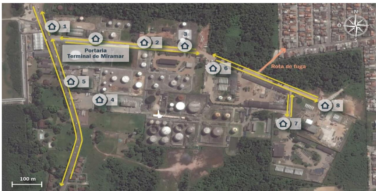
Figura 6: Portarias de acesso ao Terminal de Miramar

O Terminal Petroquímico de Miramar conta com nove (9) portarias de acesso de veículos sendo o principal acesso pela Portaria da Autoridade Portuária, localizada na Rua Salgado Filho, para depois acessarem portarias internas (específicas de cada terminal). A imagem a seguir mostra os acessos ao Terminal de Miramar.