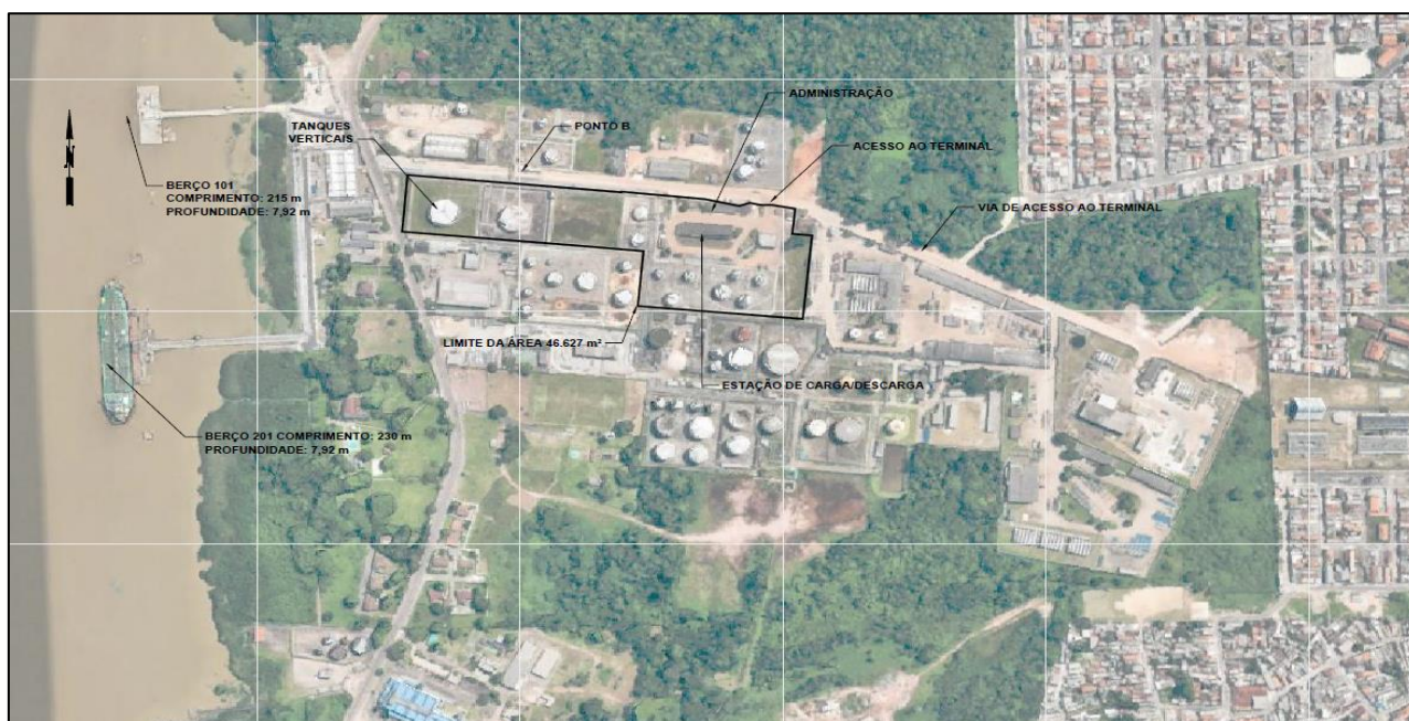
Figura 8: Localização da área do arrendamento BELO2B

A superfície da área de arrendamento é de aproximadamente 46.627 m 2 , com conexões de rodovia e cais, conforme indicado na figura a seguir.